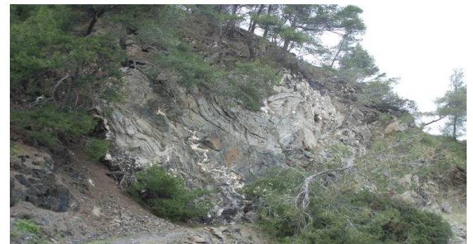
... avec filons de quartz