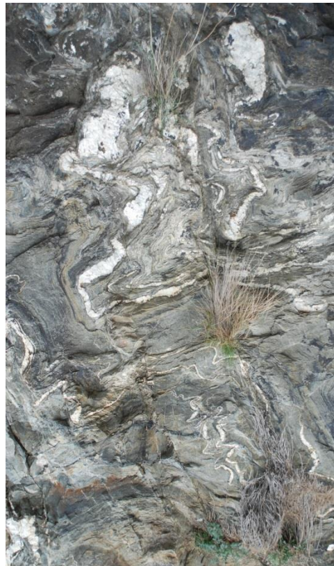
Sinuosités de quartz