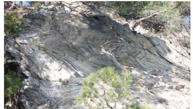
Terrains plissés ...