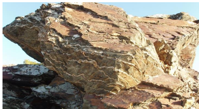
Phyllades en couches